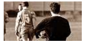
La conclusione di una partita di calcio

«Come valutare un arbitro che va spesso a cena con l'allenatore di una squadra che arbitra? È dubitabile che sia imparziale?»