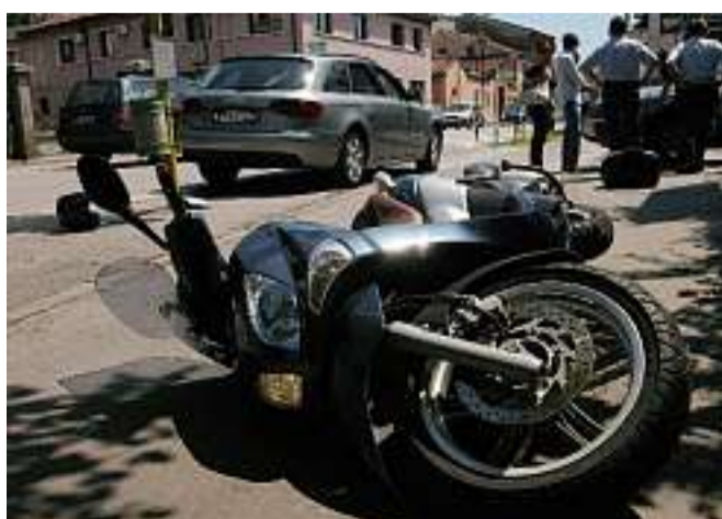
Lo scontro avvenuto ieri a mezzogiorno in viale Trento.